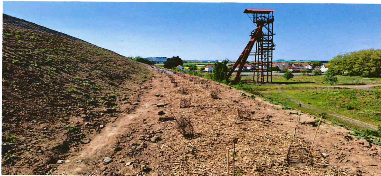
Emprise des plantations

qu'elle fera prochainement. Pour compléter son dispositif l'exploitant s'est engagé à réaliser des travaux complémentaires en créant une dépression humide dans le secteur nord Est du site. Pour l'exploitant cette dépression contribuera également à la diversification des milieux et à la valorisation écologique de l'ensemble. La zone de plantation et celle située juste au-dessus ont été ensemencées avec un mélange de trèfles et de graminées. Cet ensemencement vise à couvrir rapidement le sol et à limiter l'implantation de végétation indésirable, notamment les espèces invasives. Une seconde campagne de plantations et d'ensemencement est prévue à l'automne 2025 et au printemps 2026 pour finaliser la renaturation de l'ensemble du secteur Nord, représentant une surface totale de 1,5 ha.